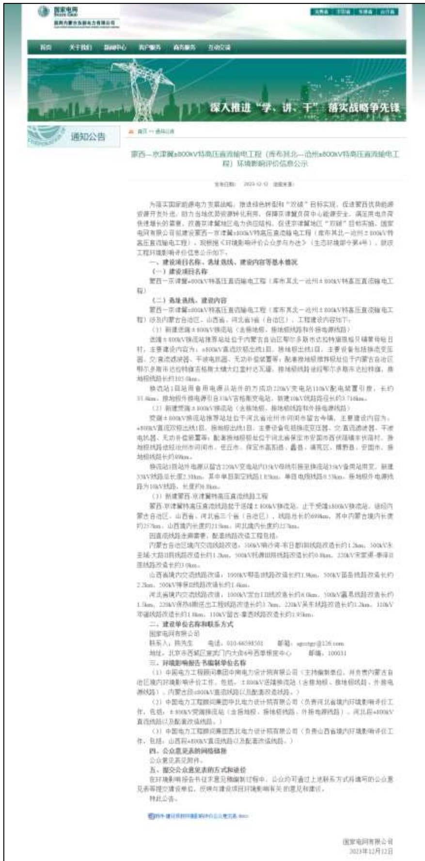
图 2-2 国网内蒙古东部电力有限公司网站首次环境影响评价信息公开截图