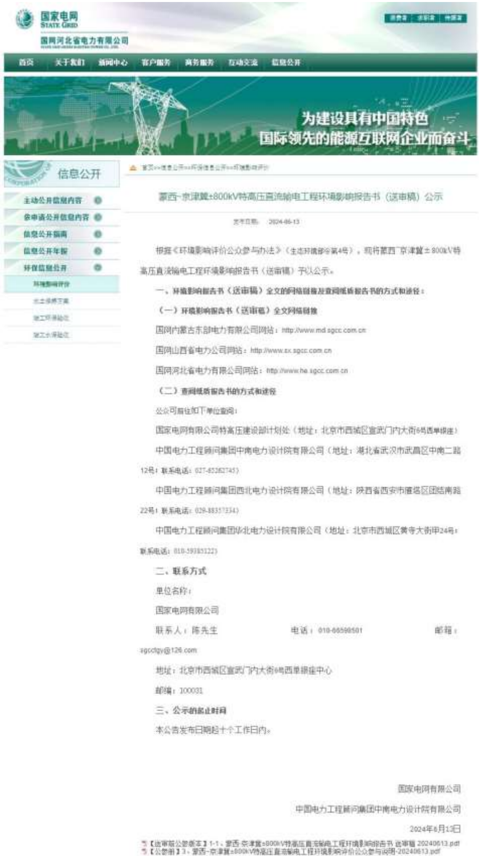
图 6-3 国网河北省电力有限公司网站公开截图