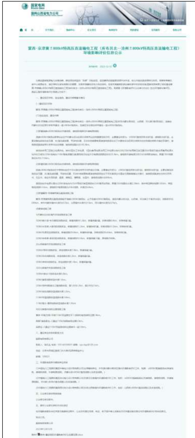
图 2-3 国网山西省电力公司网站首次环境影响评价信息公开截图