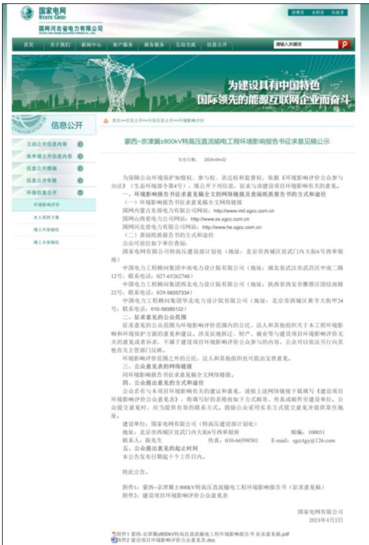
图 3-3 国网河北省电力有限公司第二次公示截图