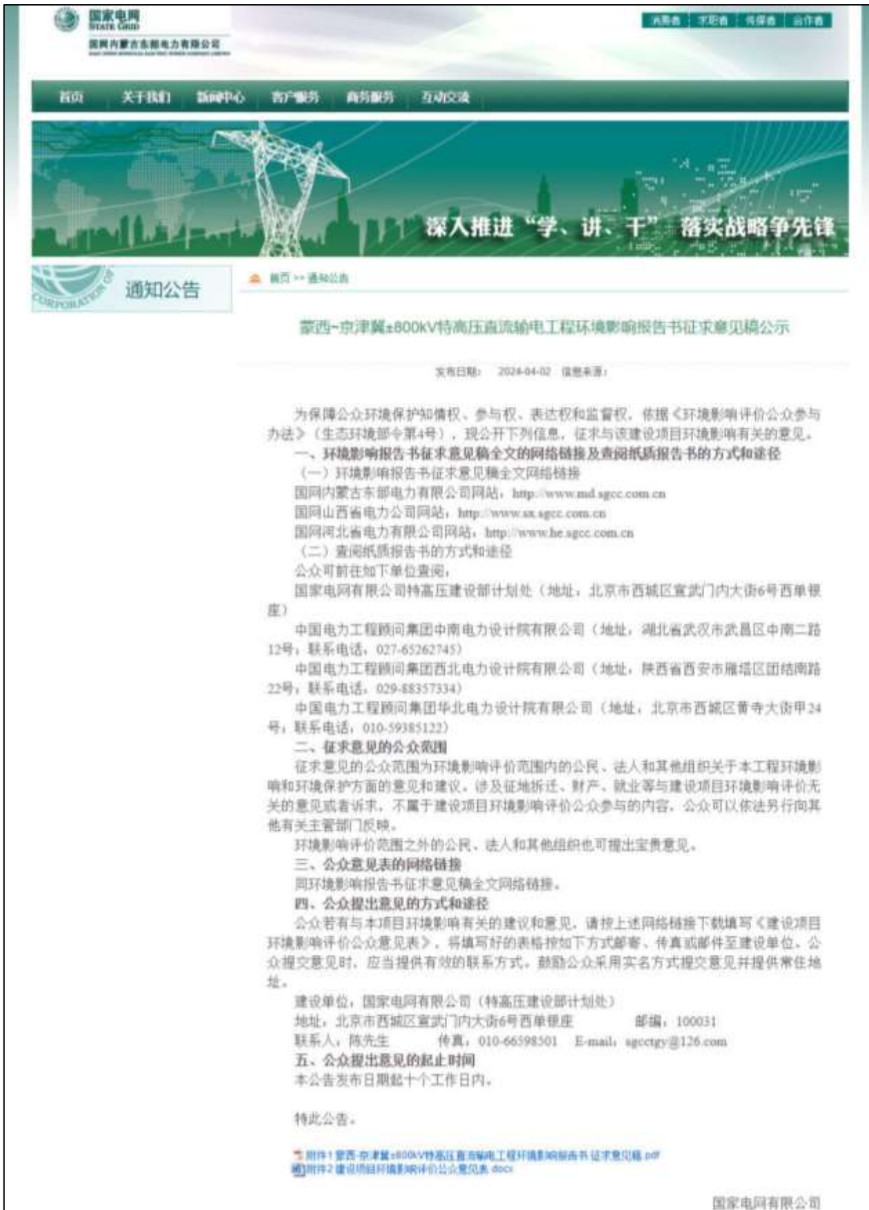
图 3-1 国网内蒙古东部电力有限公司网站第二次公示截图