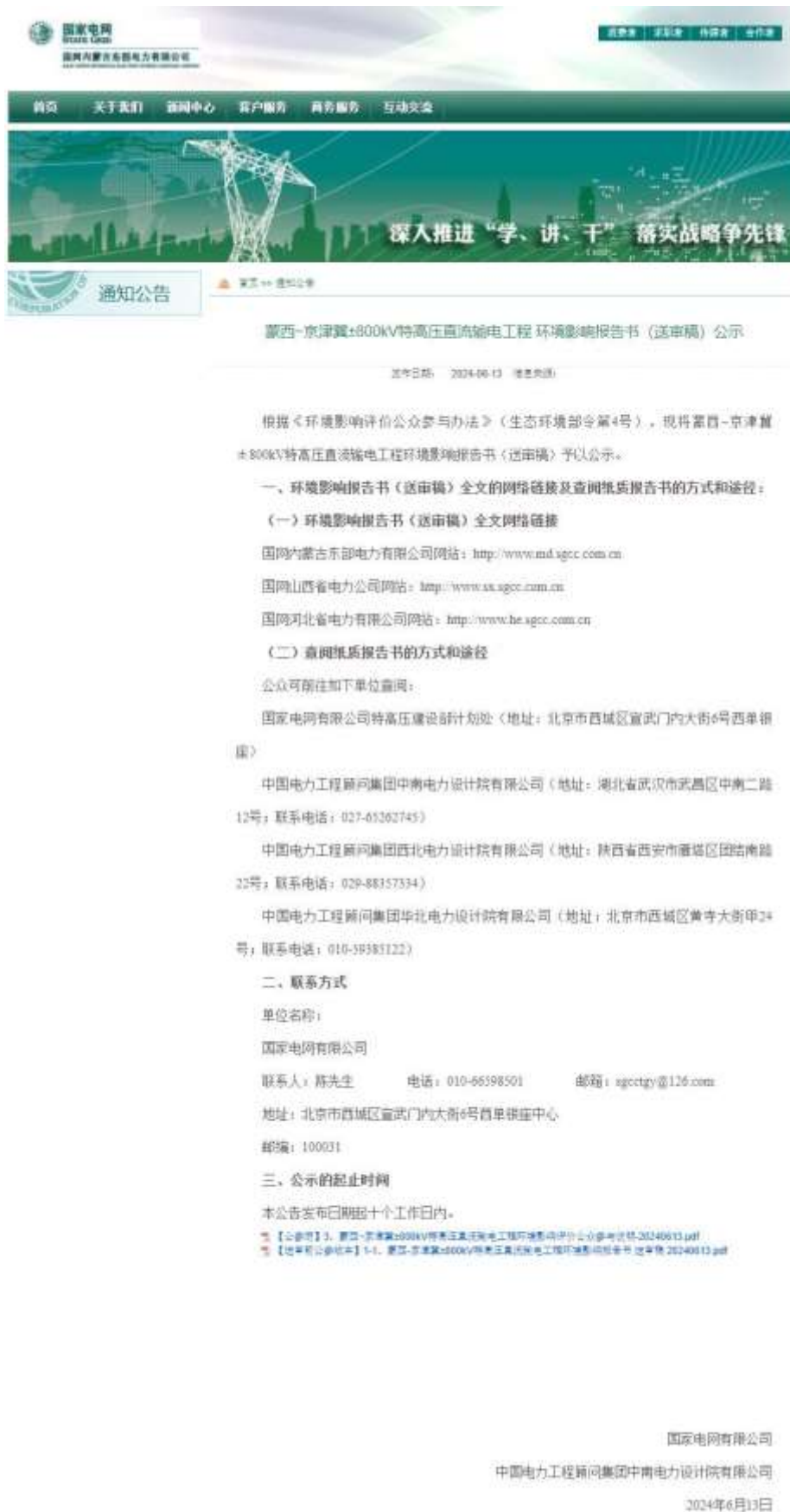
图 6-1 国网内蒙古东部电力有限公司网站公开截图