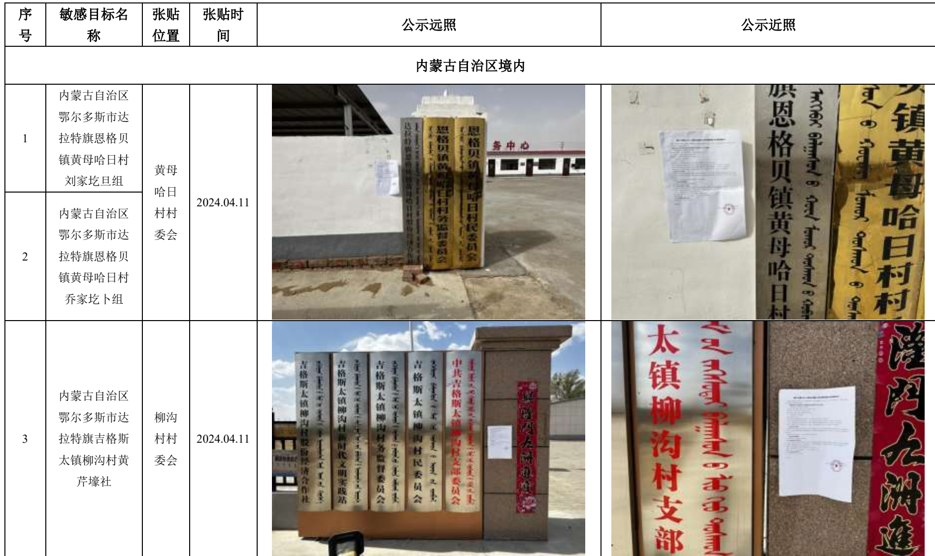
附件 1：蒙西~京津冀±800kV 特高压直流输电工程现场张贴征求意见稿公告情况一览表