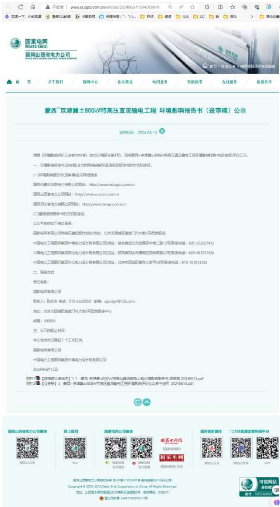
图 6-2 国网山西省电力公司网站公开截图