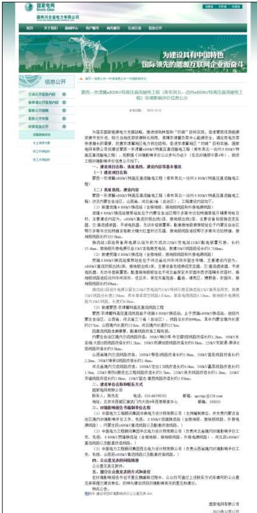
图 2-4 国网河北省电力有限公司首次环境影响评价信息公开截图